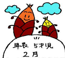
年長 5才児 2月